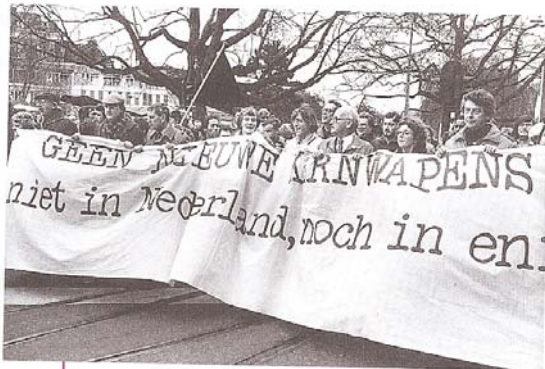
bron 33 Massale demonstratie in de jaren tachtig. Rechts vakbondsleider Wim Kok, die in de jaren negentig minister-president werd.